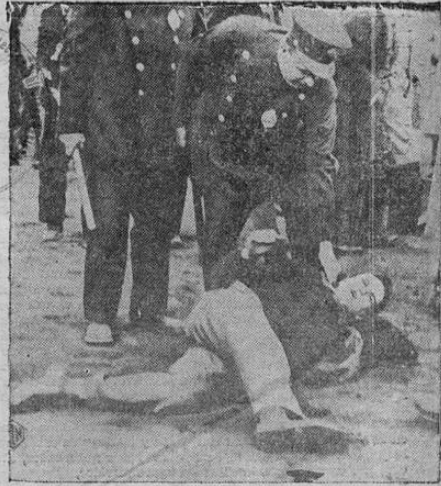
De aquí uno de los espectadores en un match de foot-ball que degeneró en desorden, quien se atrevió a contestar a la policía, de mala manera. El hecho ocurrió durante el match entre la Universidad de Pittsburg y el Instituto Técnico Cariego.

Biblioteca Central de Bibliotecas BIBLIOTECA