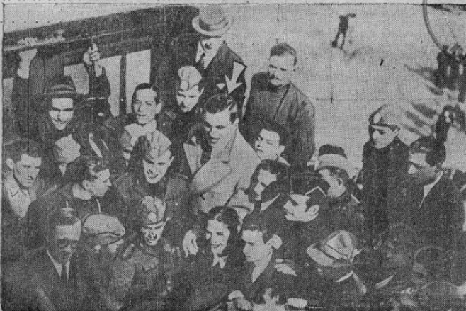
Primo Carnera, el enorme boxeador italiano, recibe una gran ovación al regresar a Italia con el propósito de ingresar al ejército y seguir la carrera militar.