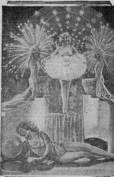
Scene from Florenz Ziegfeld's "Glorifying the American Girl" A Paramount Picture with Mary Eaton