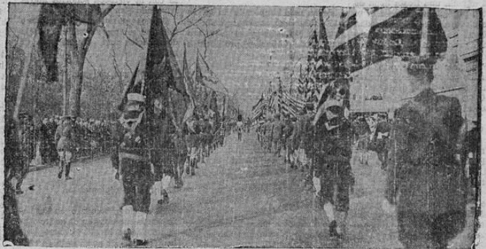
La parada anual de las banderas, desfilando por la Quinta Avenida de Nueva York. La parada se celebra todos los años, para hacer aumentar el respeto por la bandera.