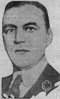
Presidente del Comité del Congreso, Congresal Hamilton Fish, de Nueva York, quien investiga las actividades de los comunistas en los Estados Unidos.